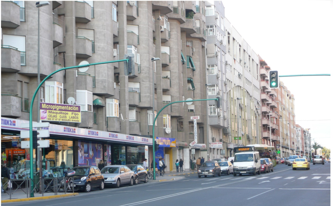
Avenida de Alicante. 2010