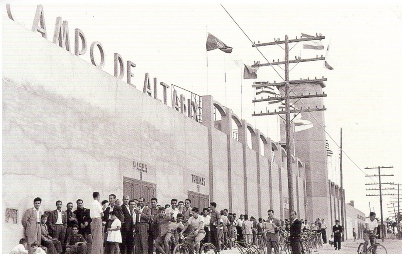
Campo de Altabix. 1959