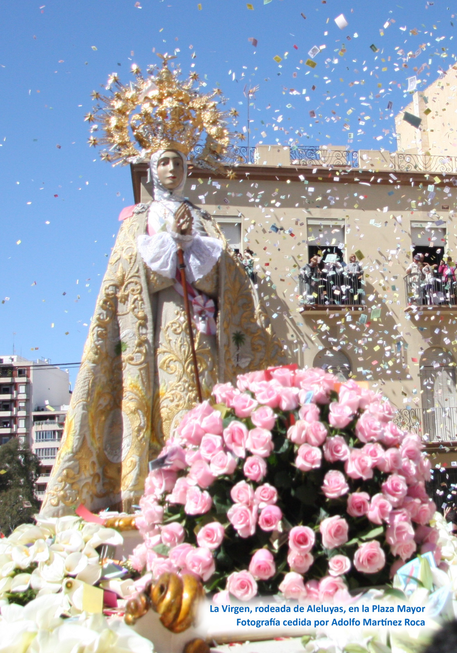
La Virgen, rodeada de Aleluyas, en la Plaza Mayor