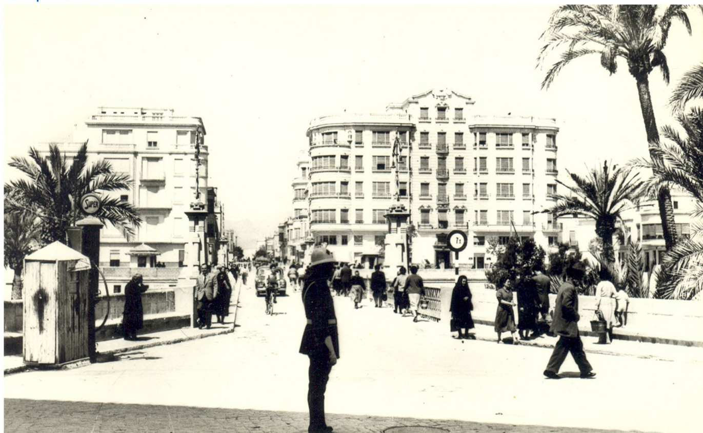
Puente de Canalejas y Reina Victoria. 1960