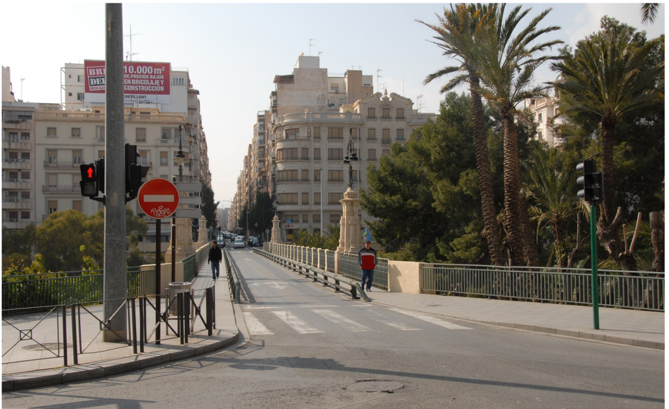
Puente de Canalejas y Reina Victoria. 2010