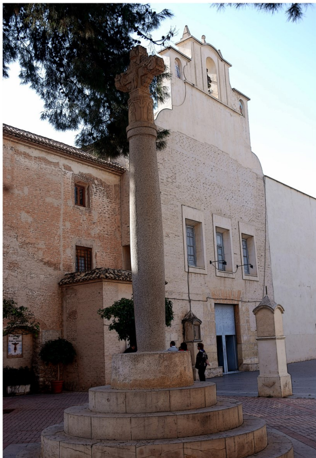
Imagen de portada: Parroquia de San José y Plaza del Santísimo Cristo de Zalamea.