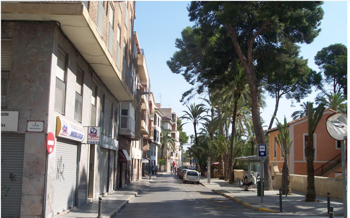
Calle Porta de la Morera, 2009