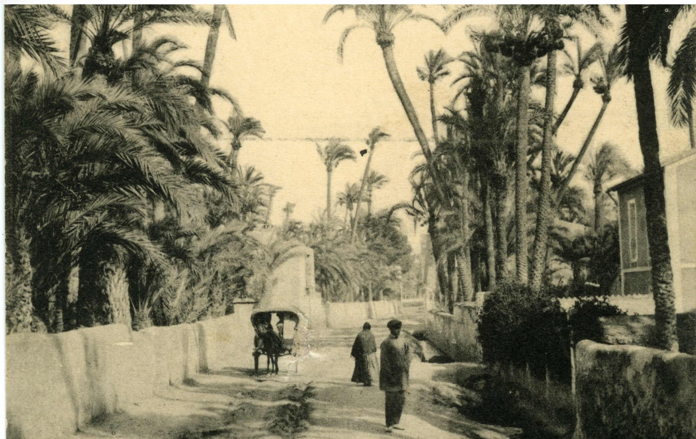
Camino de entrada a la población. 1912