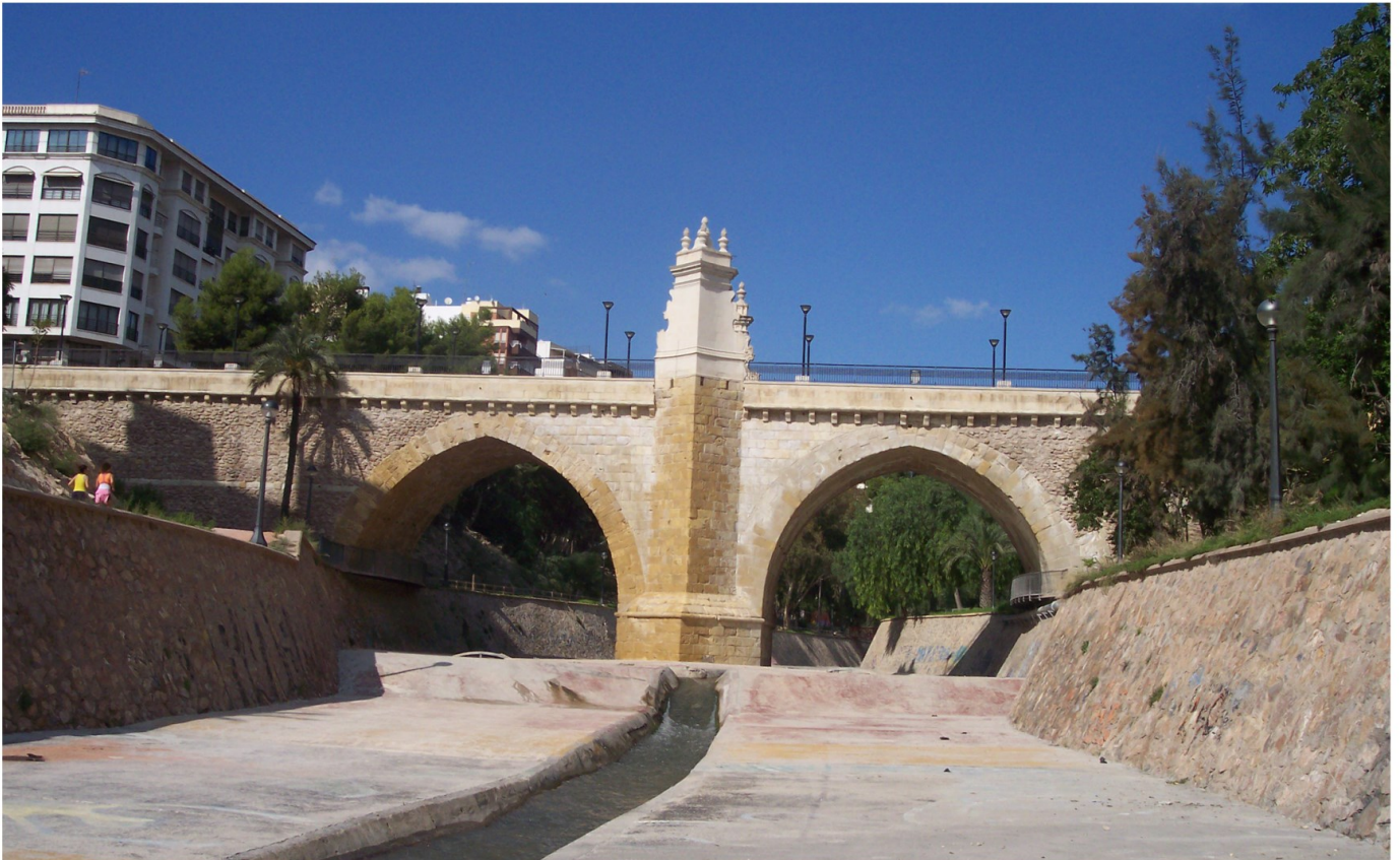
Puente de Santa Teresa, 2009