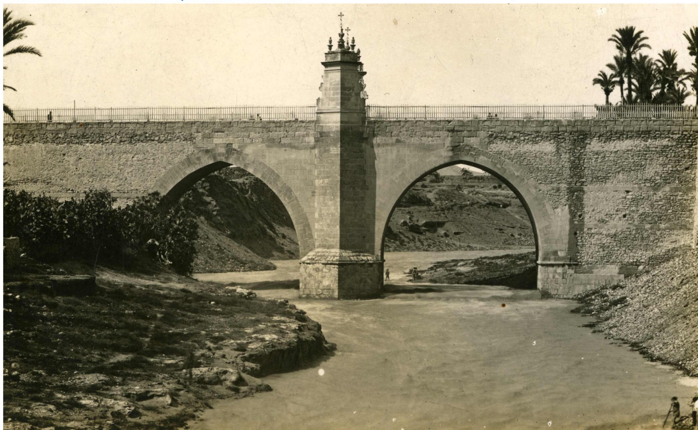
Puente de la Virgen. 1927