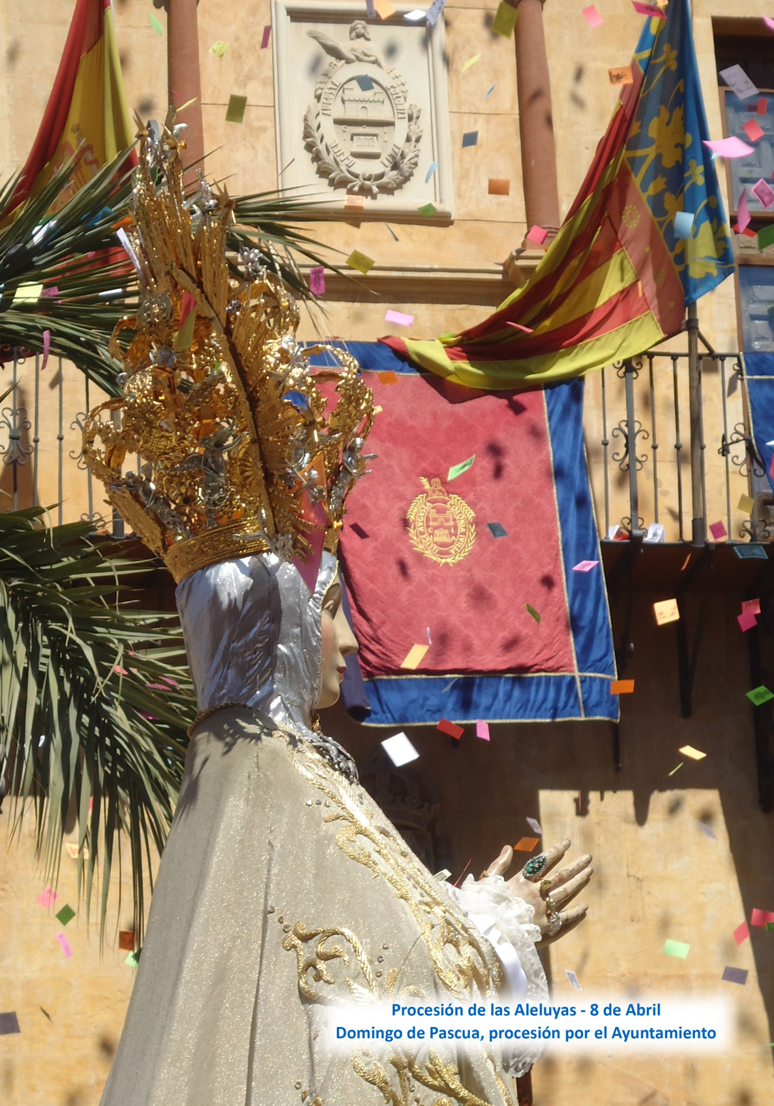
Procesión de las Aleluyas - 8 de Abril Domingo de Pascua, procesión por el Ayuntamiento