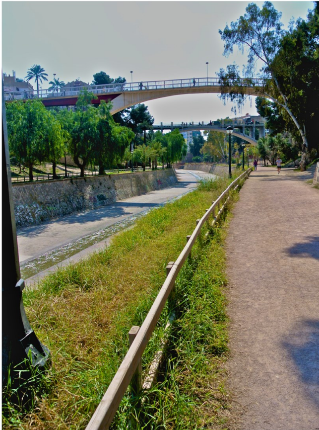
Imagen de portada: Ladera del Río Vinalopó