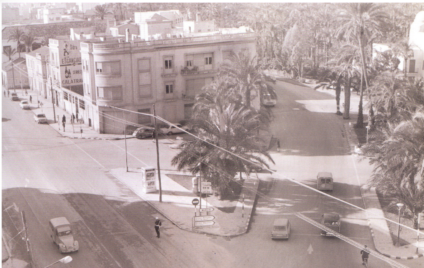
Plaza de Benidorm, 1971