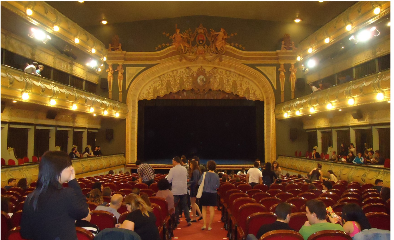
Gran Teatro, 2012