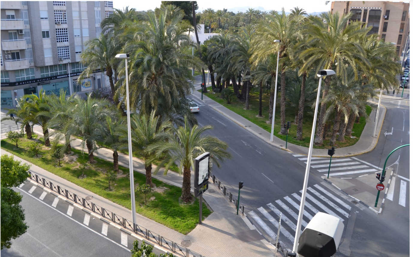
Plaza de Benidorm, 2012